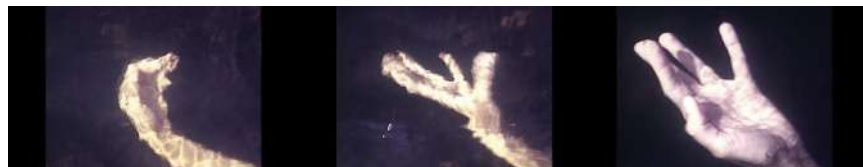
Imagem 2 - Fotogramas de Céu sobre Água , 1978.

Com foco por vezes nos movimentos das mãos, por vezes das pernas, o artista capta a luz como quem pinta um quadro, criando camadas de tonalidades fotocromáticas e direcionando a luminosidade de maneira a enfatizar a força movente da cor. Parece nos dizer, com Taussig, que “quando vemos uma cor, estamos vendo na verdade um jogo com a luz dentro, através e sobre um corpo, o corpo mesmo da cor” (Taussig 2009, 42, tradução nossa).